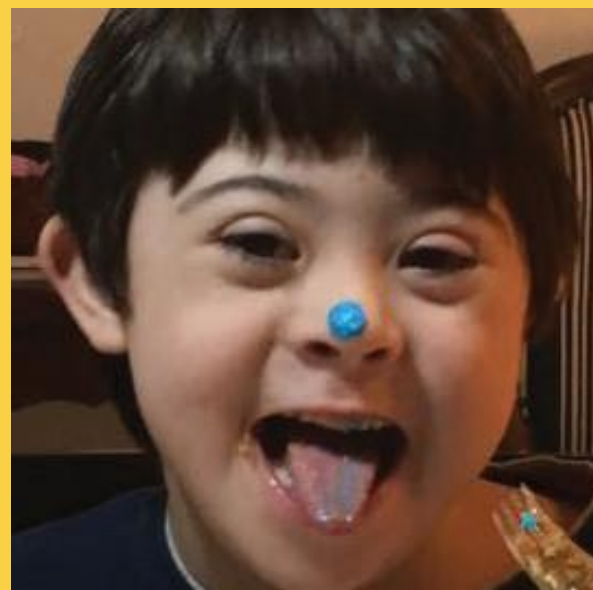
Dia da Alegria