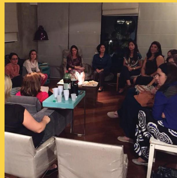
Mom's Night Out