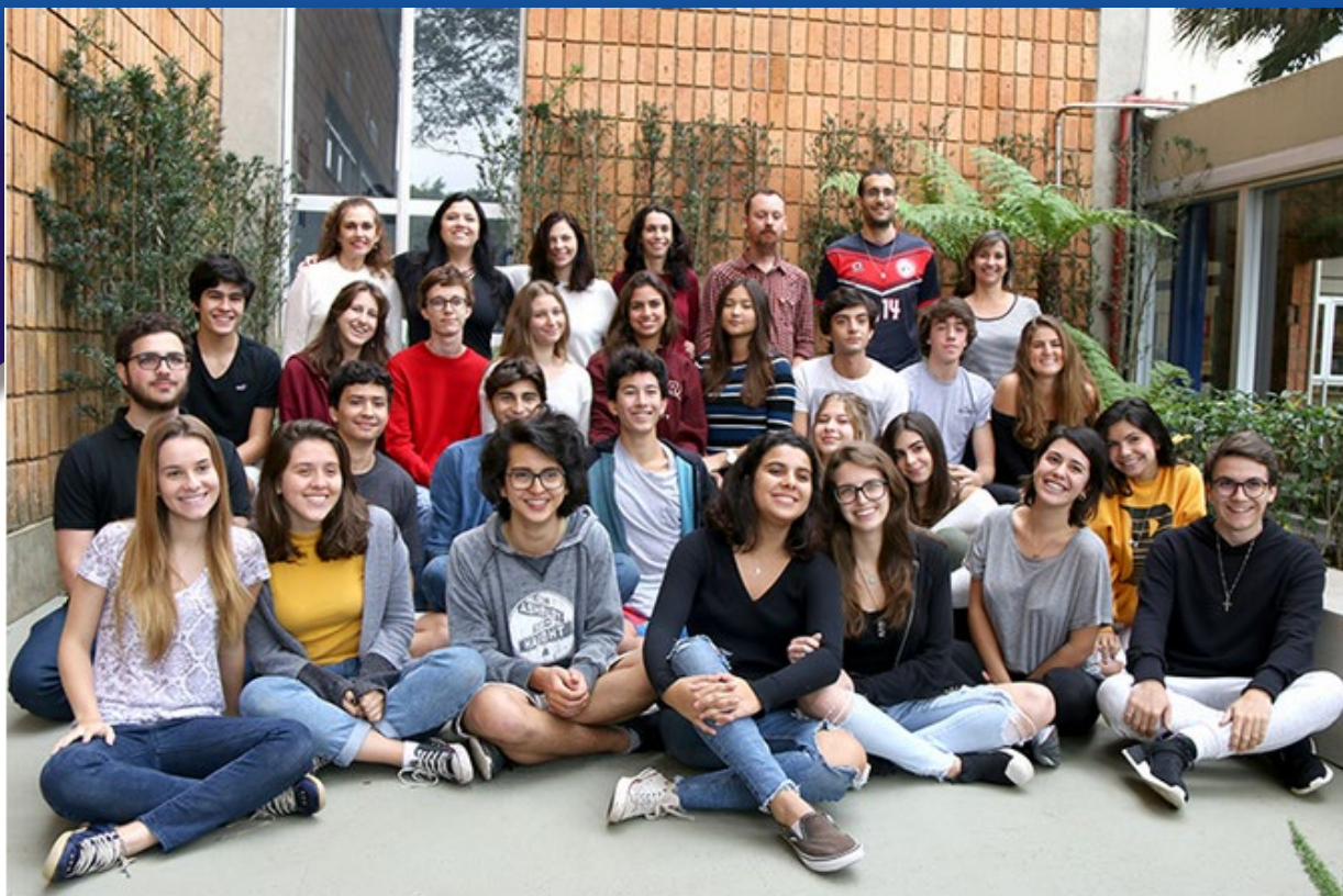
Alunos e professores da 2ª graduação do Programa de Diploma do Colégio Miguel de Cervantes